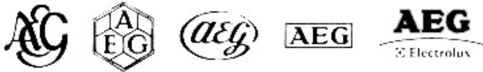
圖 1-1 德國「AEG」電器公司商標發展過程 (置中對齊)